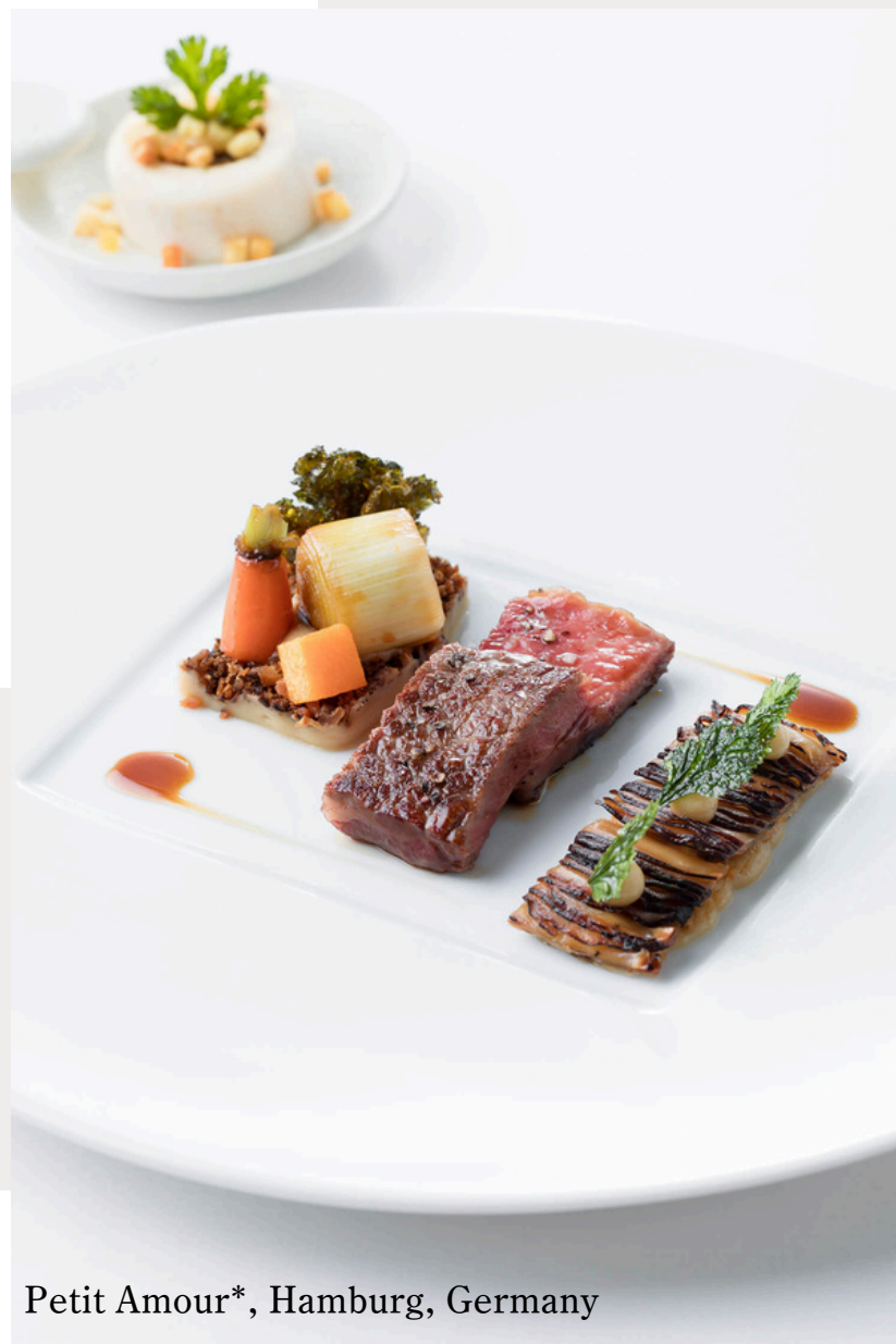
Petit Amour*, Hamburg, Germany