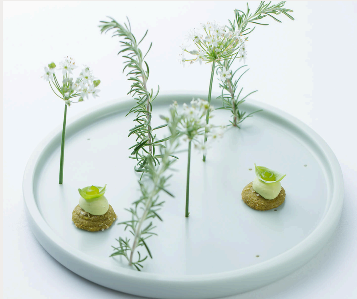
Restaurant STUCKI**, Basel, Switzerland