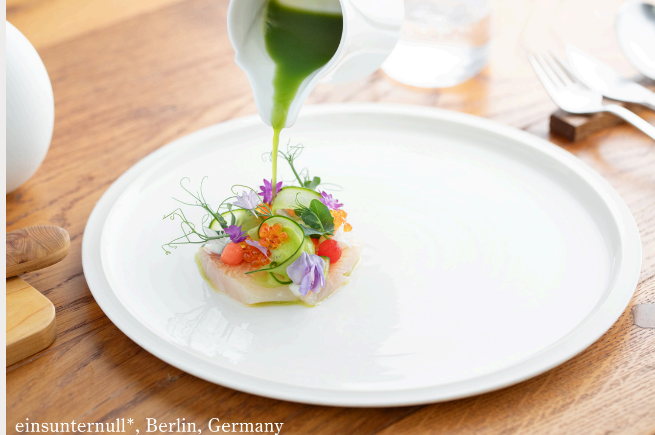
einsunternull*, Berlin, Germany