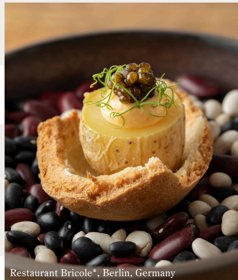
Restaurant Bricole*, Berlin, Germany