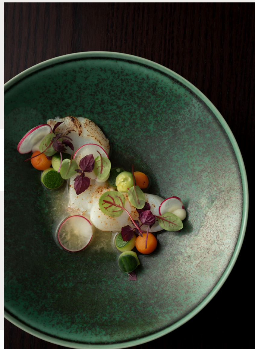
Nagaya*, Düsseldorf, Germany